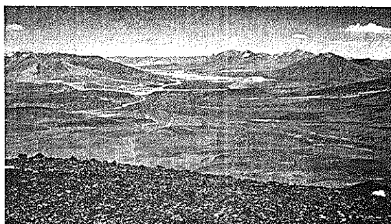
*Laguna Verde C°s San Francisco 6018msnm e Incahuasi 6621msnm.