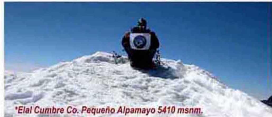
*Elal Cumbre Co. Pequeño Alpamayo 5410 msnm.