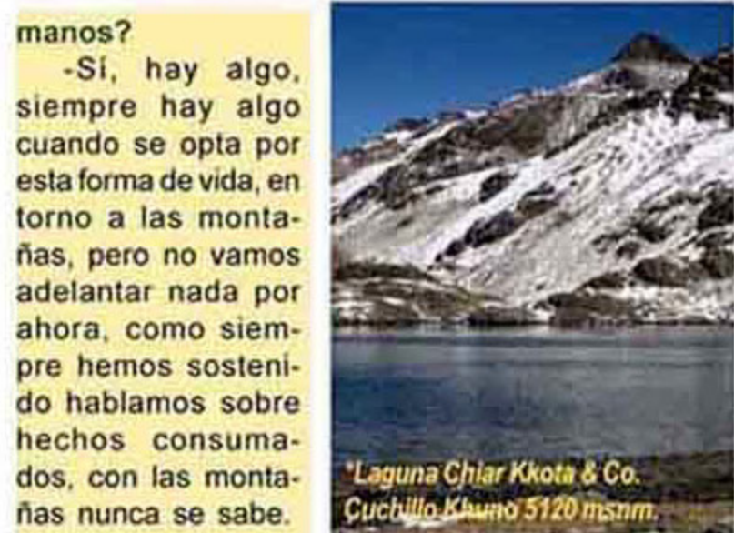
*Laguna Chiar Kkota & Co. Cuchillo Khuno 5120 msnm.