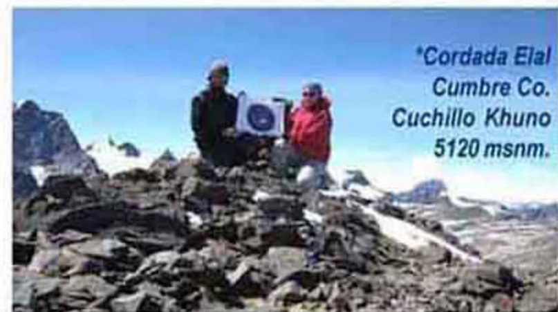
*Cordada Elal Cumbre Co. Cuchillo Khuno 5120 msnm.

-¿Tienen algún otro proyecto grande entre