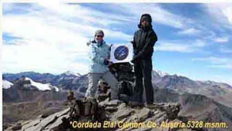
*Cordada Elal Cumbre Co. Austria 5328 msnm.